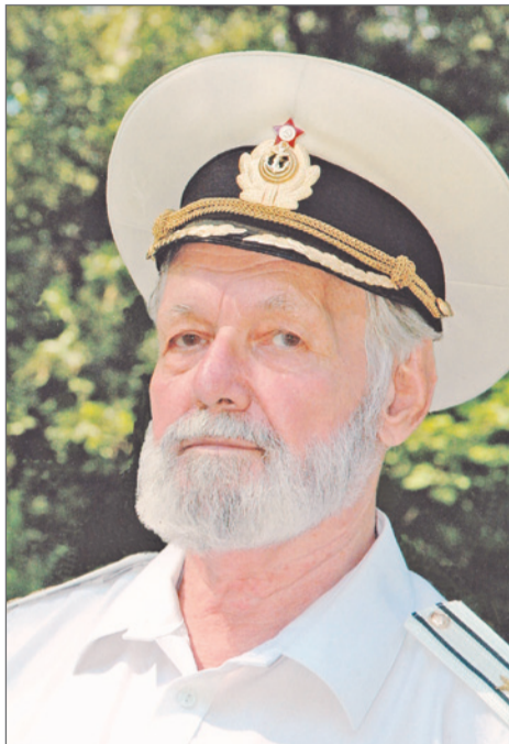
Капитан 1 ранга в отставке М.В. Коновалов

Подлодка в годы войны уничтожила 28 кораблей и судов противника, в том числе в ночь на 17 апреля 1945 г. потопила войсковой транспорт «Гойя», перевозивший 7000 гитлеровцев. На его борту находились 1300 подводников 5-й флотилии кригсмарине и 1500 солдат 4-й танковой дивизи