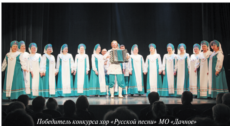
Победитель конкурса хор «Русской песни» МО «Дачное»

20 октября 2016 года в ЦДК «Кировец» прошел районный смотр-конкурс самодеятельного творчества ветеранов «Золотая осень», посвященный 100-летию Кировского района Санкт-Петербурга.