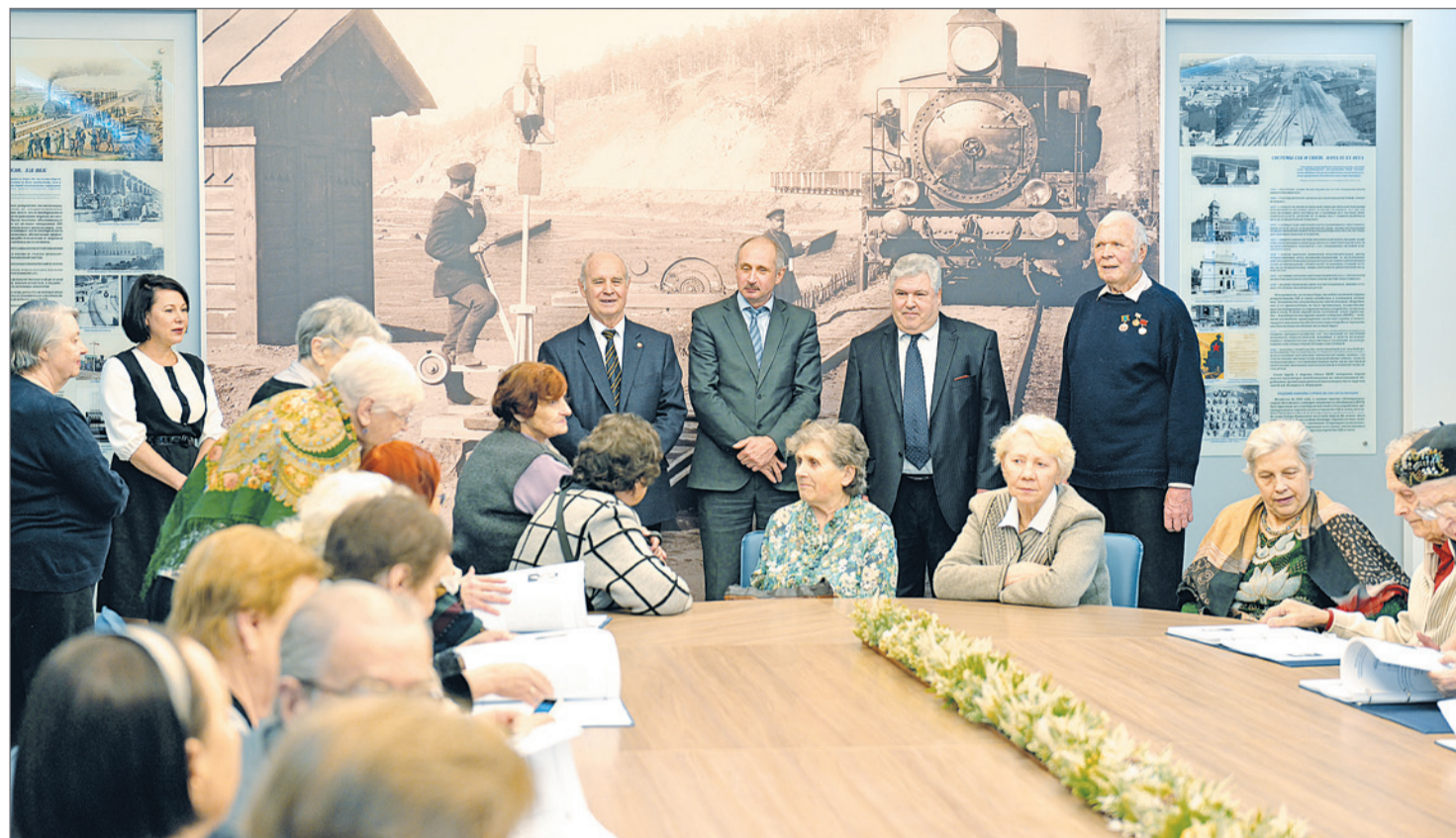
Актив совета ветеранов института «Гипротрансигналсвязь»

Международное признание разработок института позволило успешно конкурировать с зарубежными компаниями в сфере